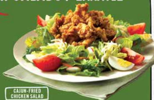
CAJUN-FRIED CHICKEN SALAD

* May contain small bones / Πιθανόν να περιέχει μικρά κόκκαλα